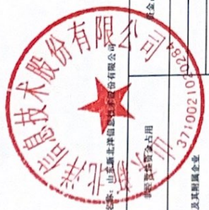
2021年度非经营性资金占用及其他关联资金往来情况汇总表